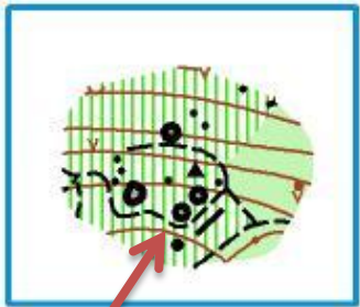
Groupe de rochers/falaise